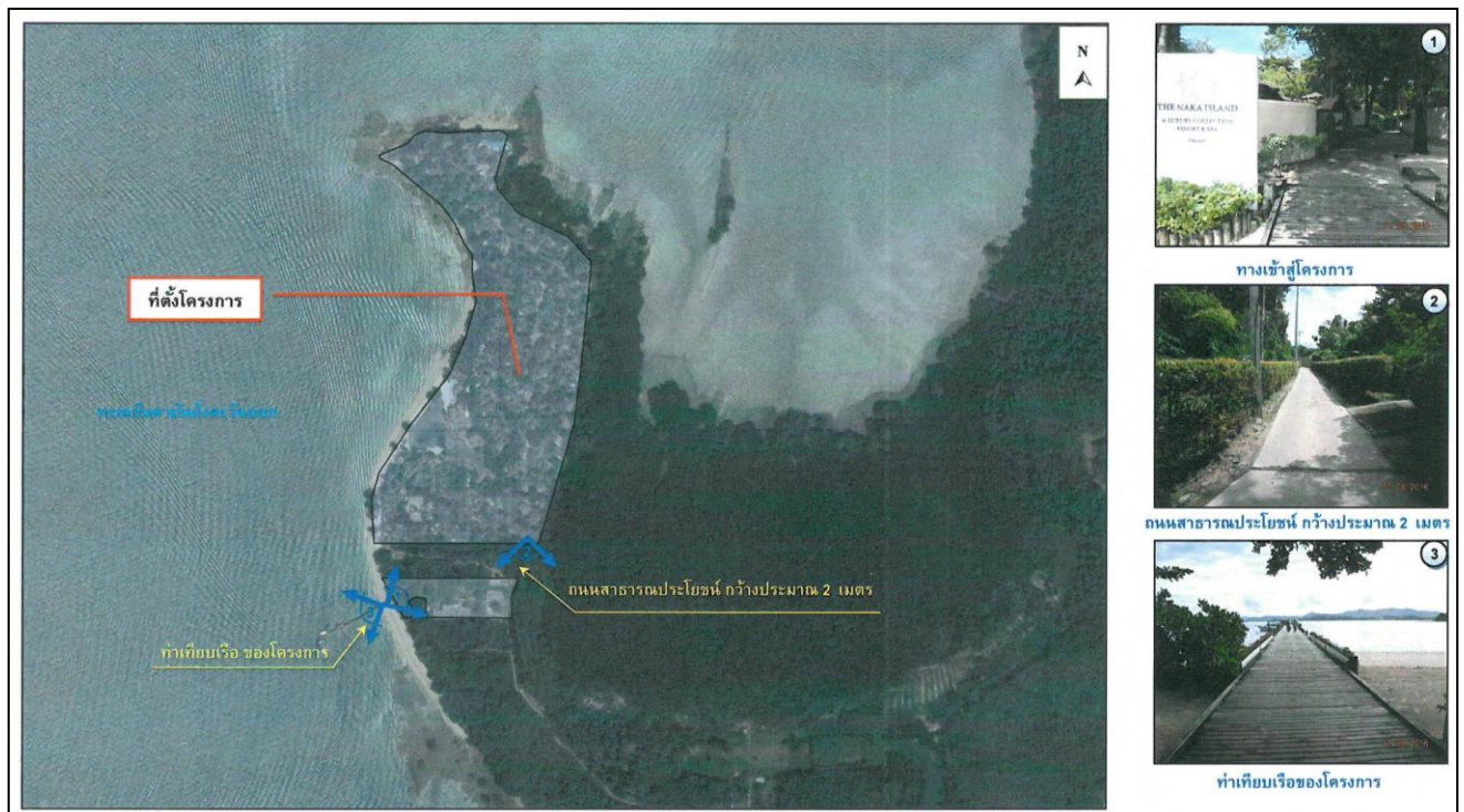
รูปที่ 2.1 พื้นที่ตั้งโครงการ